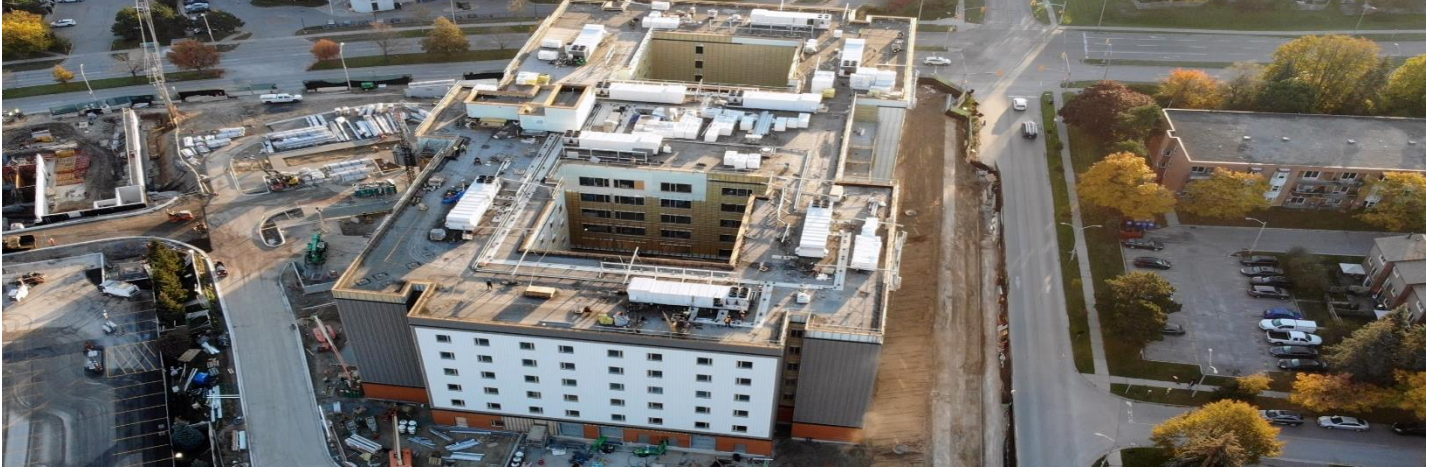
புதிதாக எழுகின்ற நீண்டகாலப் பராமரிப்பு இல்லத்தின் கிழக்குப் பகுதியின் ஒரு தோற்றம் (நவம்பர் 6, 2021)