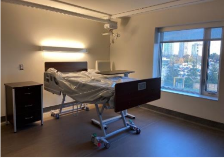
இல்லத்தின் இரண்டாவது தளத்தில் காட்சிக்கென போலியாக ஏற்படுத்திய ஒரு வதிவாளர் அறை