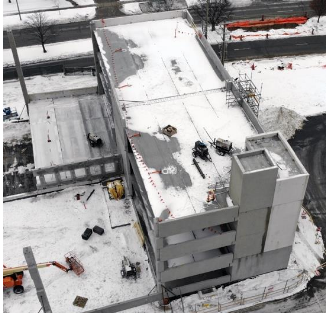
500 گاڑیوں کے پارکنگ گیارا پر جاری کام کی ایک فضائی تصویر - 6 فروری 2022

لیکریج گارڈنز میں 500 سے زیادہ نگہداشت اور انتظامیہ کا عملہ کام کرتا ہے، جن میں سے سبھی اعلیٰ تربیت یافتہ ہیں اور طویل مدتی دیکھ بھال میں کئی سالوں کا تجربہ رکھتے ہیں۔