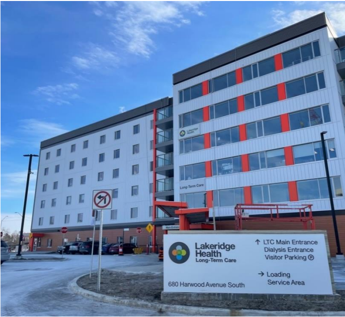
لیکریج گارڈنز کے بیرونی داخلی دروازے کا ایک منظر

لیکریج گارڈنز میں ملاقاتیوں کو کوویڈ 19 (COVID-19) کی ویکسینیشن کا ثبوت دکھانے کی ضرورت ہوتی ہے۔ ملاقاتیوں کو گھر میں داخل ہونے سے پہلے فوری اینٹیجین ٹیسٹ کروانے کی بھی ضرورت ہوگی۔ تمام عملہ، نگہداشت کنندگان، مہمان اور رہائشی صحت عامہ کے اقدامات پر حسب ضرورت عمل کرتے رہیں گے جیسا کہ داخلہ کے وقت اسکریننگ اور ٹیسٹنگ، ماسک پہننا، جسمانی دوری، ہاتھ صاف رکھنا، اور بیمار ہونے پر گھر پر رہنا۔