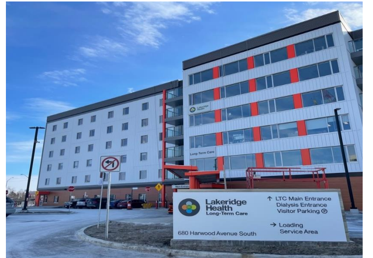
லேக்ரிட்ஜ் கார்ட்ஸின் முன் நுழைவாயிலின் தோற்றம்