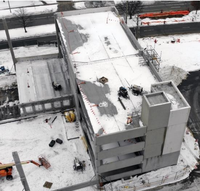
தற்போது நிர்மாணிக்கப்படும் 500 வாகனங்களுக்கான தரிப்பிடக் கொட்டிலின் வான்வழி புகைப்படம், 2022 பெப்ரவரி 6 இல் எடுக்கப்பட்டது.

பார்வையிட வருவோர் கொவிட்-19 பெருந்தொற்றுக்கு எதிரான தடுப்பூசி ஏறியிருப்பதை நிரூபிக்கும் ஆதாரத்தைக் காண்பிக்க வேண்டுமென லேக்ரிட்ஜ் கார்ட்ஸ் தேவைப்படுத்துகின்றது. அத்துடன் அவர்கள் இல்லத்திற்குள் நுழைய முன்னர் துரித அன்டிஜன் பரிசோதனை ஒன்றைச் செய்ய வேண்டும் எனவும் தேவைப்படுத்தப்படுகின்றனர். தேவையான பொது சுகாதார நடவடிக்கைகளை பணியாளர்கள், பராமரிப்பாளர்கள், வருகைதருவோர் மற்றும் குடியிருப்பாளர்கள் அனைவரும் தொடர்ந்து கடைப்பிடிக்க வேண்டும். நுழைவாயிலில் ஸ்கிரீனிங் மற்றும் பரிசோதனை என்பவற்றுக்கு உட்படுத்தல், முகக்கவசம் அணிதல், உடல்சார் இடைவெளியைப் பேணுதல், கைகளை சுத்திகரித்தல் மற்றும் நோயுற்றுள்ள போது இல்லத்திலேயே தங்கியிருத்தல் என்பன அத்தகைய பொது சுகாதார நடவடிக்கைகளை முக்கியமானவை ஆகும்.