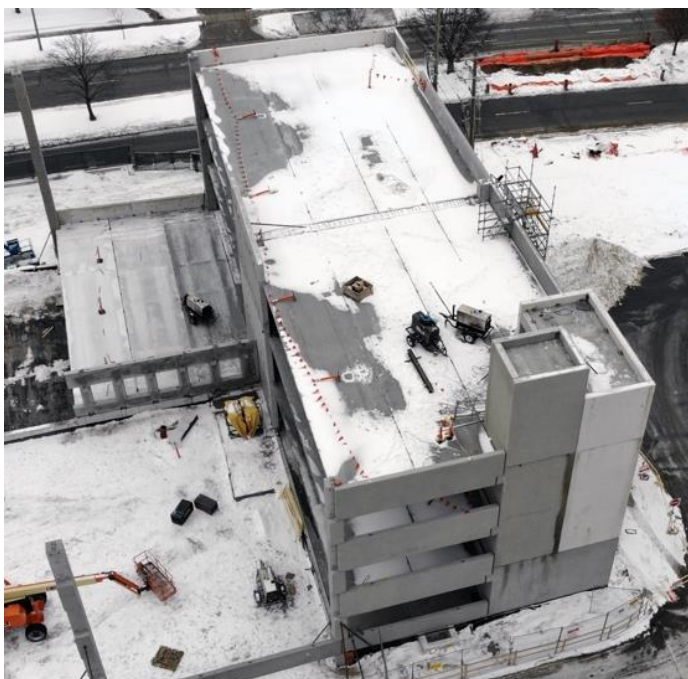
Foto aérea del estacionamiento con 500 lugares en progreso el 6 de febrero de 2022

Más de 500 miembros del personal de atención y de administración trabajan en Lakeridge Gardens y todas estas personas están altamente capacitadas y tienen muchos años de experiencia en la atención de enfermos crónicos.