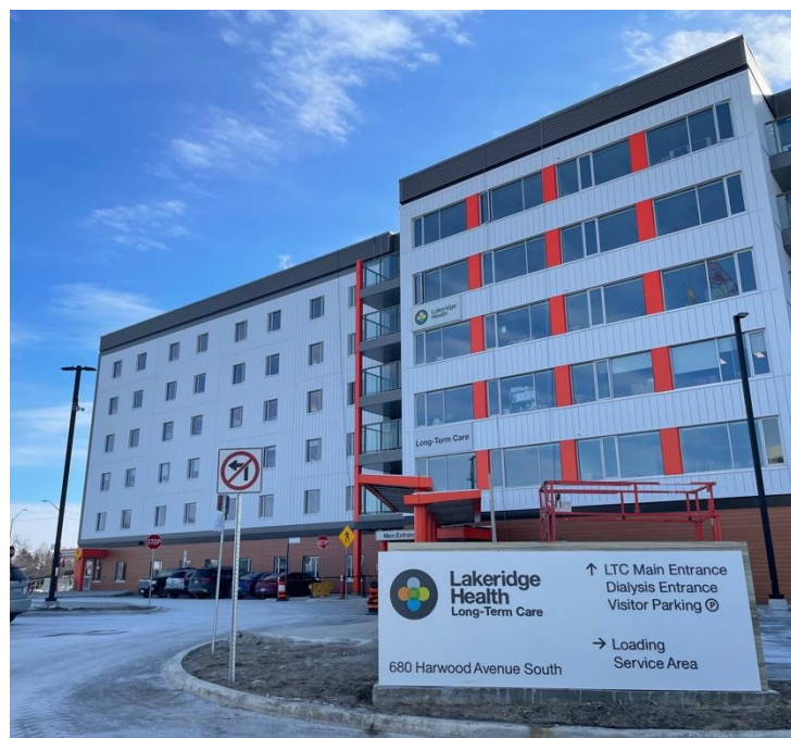
Vista de la entrada delantera de Lakeridge Gardens

Lakeridge Gardens exige a los visitantes una prueba de su vacunación contra la COVID-19. También se les exigirá que se realicen un test rápido de antígenos antes de ingresar al hogar. Todo el personal, los cuidadores, los visitantes y los residentes seguirán cumpliendo con las medidas de salud pública exigidas como la examinación y las pruebas en la entrada, el uso de mascarilla, la distancia física, el lavado de manos y quedarse en casa si no se sienten bien.