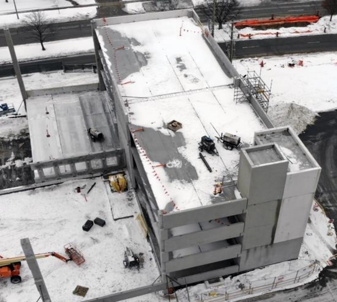
6 ફેબ્રુઆરી, 2022 નાં દિવસે 500-સ્પોટ પાર્કિંગ ગેરેજનું કામ ચાલી રહ્યું છે તેનો એરિઅલ ફોટો

Lakeridge Gardens આવવા માટેની જરૂરિયાત એ છે કે COVID-19ની સામે રસીકરણ કરાવ્યું હોવાની સાબિતી બતાવી પડે છે. મુલાકાતીઓએ ઘરમાં દાખલ થતાં પહેલાં ઝડપી એન્ટિજેન પરીક્ષણ પણ કરાવવાનું રહેશે. તમામ કર્મચારી-વર્ગ, કેરગિવર્સ અને નિવાસીઓ જરૂર મુજબ જાહેર સ્વાસ્થ્યનાં પગલાંની પ્રણાલીનું પાલન કરવું ચાલુ રાખશે, જેમ કે, દાખલ થતી વખતે તપાસ અને પરીક્ષણ, મારસ્ક પહેરવું, શારીરિક અંતર જાળવવું, હાથ સ્વચ્છ રાખવા તેમજ જ્યારે બીમાર હો ત્યારે ઘરે રહેવું.