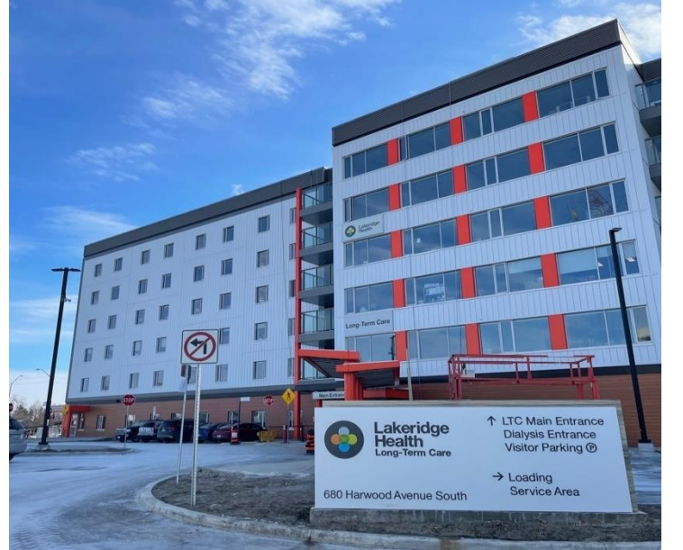
Lakeridge Gardens ના આગળનાં પ્રવેશદ્વારનું એક દૃશ્ય