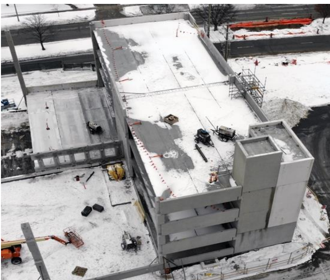
Photo aérienne du stationnement de 500 places en cours de réalisation le 6 février 2022

Plus de 500 membres du personnel soignant et administratif travaillent à Lakeridge Gardens. Tous sont hautement qualifiés et possèdent une longue expérience des soins de longue durée.