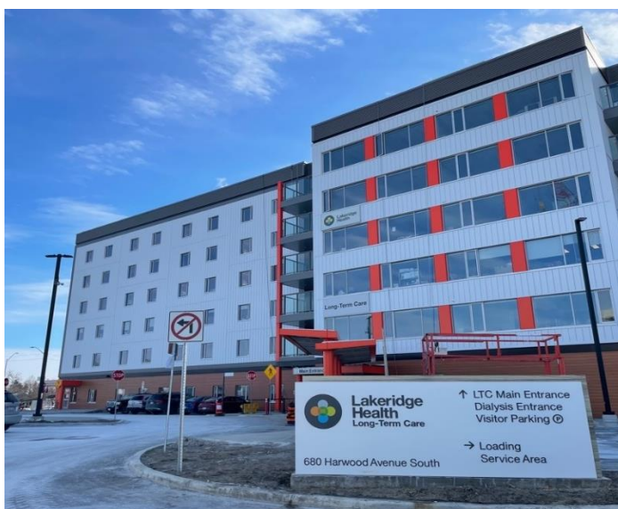
Vue de l'entrée principale de Lakeridge Gardens

Lakeridge Gardens demande aux visiteurs de présenter une preuve de vaccination contre la COVID-19. Les visiteurs devront également passer un test d'antigène rapide avant d'entrer dans le foyer. L'ensemble du personnel, des soignants, des visiteurs et des résidents continueront à appliquer les mesures de santé publique requises, telles que le dépistage et le test à l'entrée, le port du masque, la distanciation physique, l'hygiène des mains et le maintien à domicile en cas de maladie.