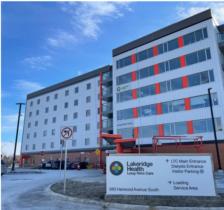
نمایی از ورودی جلویی مرکز Lakeridge Gardens

مرکز Lakeridge Gardens ملاقات‌کنندگان را ملزم می‌داند که مدرک واکسیناسیون کووید-19 خود را نشان دهند. همچنین ملاقات‌کنندگان باید یک تست آنتی‌ژن سریع نیز قبل از ورود به مرکز بدهند. کلیه پرسنل، مراقبان، ملاقات‌کنندگان، و ساکنان موظف هستند همچنان اقدامات بهداشت عمومی را طبق الزام انجام دهند، از جمله غربالگری و تست دادن موقع ورود به مرکز، ماسک زدن، فاصله‌گذاری فیزیکی، بهداشت دست، و ماندن در خانه موقعی که کسالت دارند.