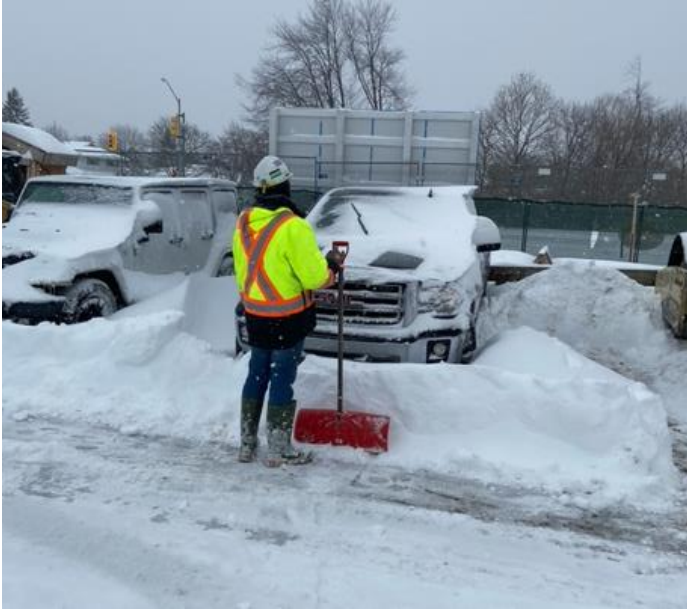
پی سی ایل ٹیم کا ایک رکن ڈاکٹروں کی پارکنگ کی جگہ سے برف صاف کر رہا ہے۔

ایجیکس نے 17 جنوری کو ریکارڈ توڑ موسم سرما کے طوفان کے دوران 50 سینٹی میٹر برف گرتی دیکھی۔ اس سے نمٹنے کے لیے، طویل مدتی نگہداشت کی تعمیراتی سائٹ کے 20 سے زیادہ کارکنوں نے ایجیکس پکرننگ ہسپتال (Ajax Pickering Hospital) کے پارکنگ کے حصوں سے بیلچہ کے ساتھ برف صاف کرنے کے لیے رضاکارانہ طور پر اپنا وقت دیا۔ ان کی ناقابل یقین کوششوں کی بدولت، ہسپتال کا عملہ ضروری فرنٹ لائن نگہداشت کے ساتھ آگے بڑھ سکتا ہے اور مریض محفوظ طریقے سے ہسپتال تک رسائی حاصل کر سکتے ہیں۔