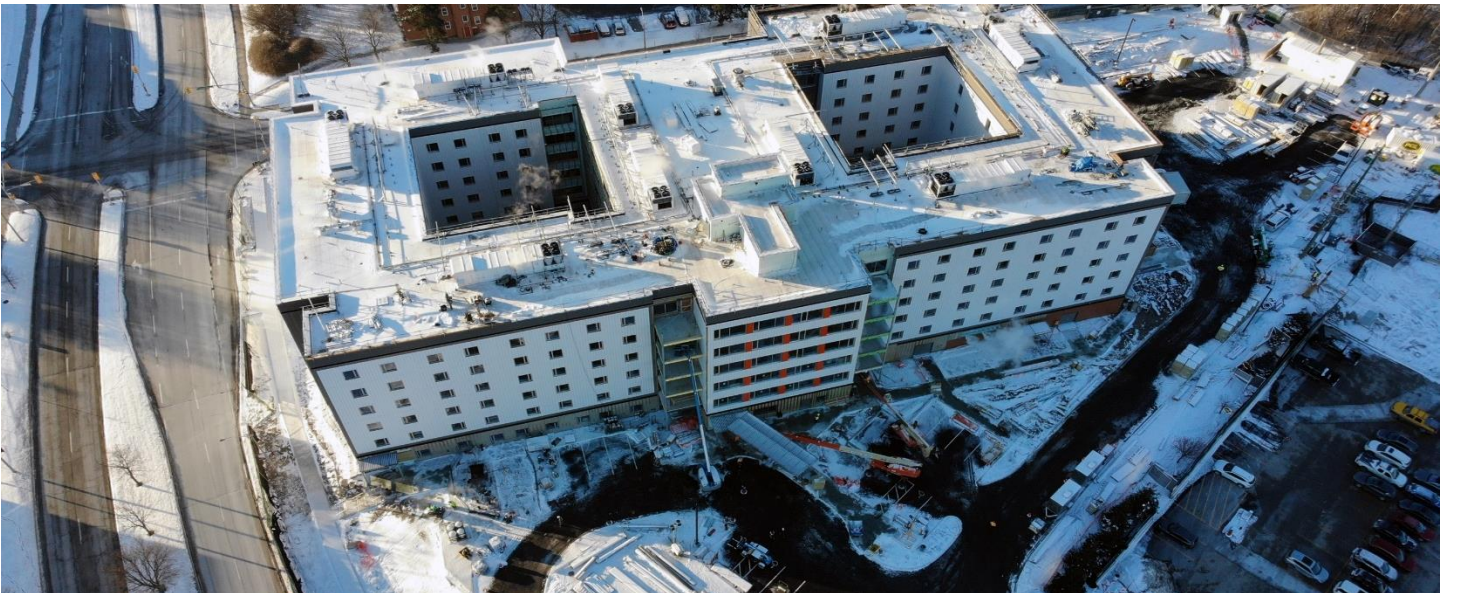
புதிய இல்லத்தின் முன்புற நுழைவாயில் சுற்றிலும் நடைபாதை, வாகனத் தரிப்பிடங்களுடன் (ஜனவரி 3, 2022)

இந்த இறுதி நிர்மாணத் தறுவாயில், தளத்தை சுத்தம் செய்ய வேண்டியிருப்பதால் சற்று ஒலித் தொந்தரவுகள் இருக்கும். நிர்மாணத்துக்கு அருகில் வசிக்கும் ஒவ்வொருவருக்கும் அவர்களது பொறுமைக்கும் புரிதலுக்கும் தொடர்ந்து நன்றி சொல்கிறோம்.