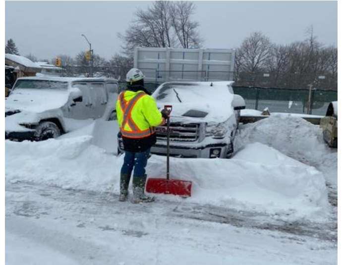
ஒரு PCL குழு உறுப்பினர் மருத்துவர்களின் வாகனத் தரிப்பிடத்தில் பனியை அகற்றுகிறார்

ஜனவரி 17ல் இதுவரையில்லாதபடி 50 சென்டிமீட்டர் அளவு பனிப்பொழிவை Ajax கண்டது. நீண்டகாலப் பராமரிப்பு நிர்மாணத் தளத்தைச் சேர்ந்த 20 பக்கும் மேற்பட்ட தொழிலாளர்கள் தன்னார்வத்துடன் தங்கள் நேரத்தை பனியை வாரித் தள்ளுவதிலும் Ajax Pickering மருத்துவமனையின் வாகன நிறுத்துமிடங்களில் பனியை அகற்றுவதிலும் செலவிட்டனர். அவர்களது அளப்பரிய முயற்சிகளுக்கு நன்றி. மருத்துவமனைத் தொழிலாளர்கள் தங்களது அத்தியாவசிய முதல்நிலைப் பராமரிப்பைத் தொடரவும், நோயாளிகள் மருத்துவமனையை பாதுகாப்பாக அணுகவும் செய்யலாம்.