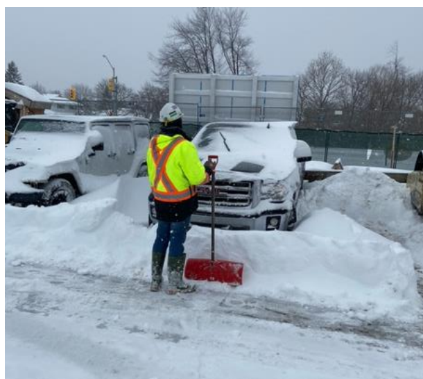
Un miembro del equipo de PCL limpiando la nieve en el estacionamiento para médicos

En Ajax cayeron 50 centímetros de nieve durante la tormenta de invierno sin precedentes del 17 de enero. Como respuesta, más de 20 trabajadores de la construcción del centro de atención a largo plazo ofrecieron su tiempo para palear y quitar la nieve de los estacionamientos de Ajax Pickering Hospital. Gracias a sus increíbles esfuerzos, el personal del hospital pudo continuar con la atención esencial de primera línea y los pacientes pudieron acceder al hospital de manera segura.