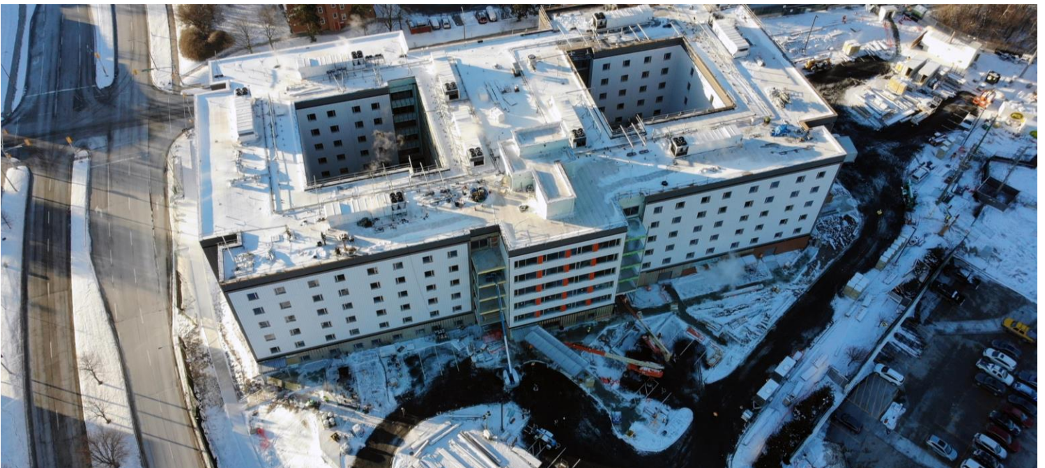
Entrada principal del nuevo centro con un pasillo cubierto y lugares para estacionar (3 de enero de 2022)

Durante esta fase final de construcción, se llevará a cabo la limpieza del lugar y es posible que haya algunas molestias sonoras. Continuamos agradeciendo a todas las personas que residen en el área inmediata del lugar de la obra por su paciencia y comprensión.