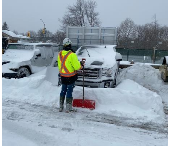
PCL ਟੀਮ ਦਾ ਇੱਕ ਮੈਂਬਰ ਡਾਕਟਰਾਂ ਦੇ ਪਾਰਕਿੰਗ ਲਾਟ ਵਿੱਚ ਬਰਫ ਸਾਫ਼ ਕਰਦੇ ਹੋਏ

Ajax ਨੇ 17 ਜਨਵਰੀ ਨੂੰ ਰਿਕਾਰਡ-ਤੇੜ ਸਰਦੀਆਂ ਦੇ ਤੂਫਾਨ ਦੌਰਾਨ 50 ਸੈਂਟੀਮੀਟਰ ਬਰਫ ਦੇਖੀ। ਜਵਾਬ ਵਿੱਚ, ਲੰਬੇ ਸਮੇਂ ਦੀ ਦੇਖਭਾਲ ਦੀ ਉਸਾਰੀ ਵਾਲੀ ਥਾਂ ਦੇ 20 ਤੋਂ ਵੱਧ ਕਰਮਚਾਰੀਆਂ ਨੇ Ajax Pickering Hospital ਦੇ ਪਾਰਕਿੰਗ ਲਾਟਾਂ ਤੋਂ ਬੇਲਚਿਆਂ ਨਾਲ ਬਰਫ ਹਟਾਉਣ ਲਈ ਆਪਣਾ ਸਮਾਂ ਦਿੱਤਾ। ਉਹਨਾਂ ਦੇ ਸ਼ਾਨਦਾਰ ਯਤਨਾਂ ਲਈ ਧੰਨਵਾਦ, ਹਸਪਤਾਲ ਦਾ ਸਟਾਫ਼ ਜ਼ਰੂਰੀ ਫਰੰਟ-ਲਾਈਨ ਦੇਖਭਾਲ ਦੇ ਨਾਲ ਅੱਗੇ ਵੱਧ ਸਕਿਆ ਅਤੇ ਮਰੀਜ਼ ਸੁਰੱਖਿਅਤ ਢੰਗ ਨਾਲ ਹਸਪਤਾਲ ਤੱਕ ਪਹੁੰਚ ਕਰ ਸਕੇ।